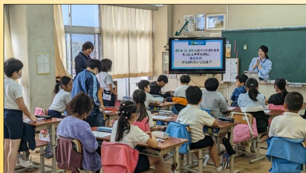
サントリーの専任講師から説明を受ける子どもたち

今後は、リサイクルの見える化が図られるとともに、水平リサイクルへ移行することで、新たな化石由来原料の使用量を減らし、循環型社会の形成を推進してまいります。